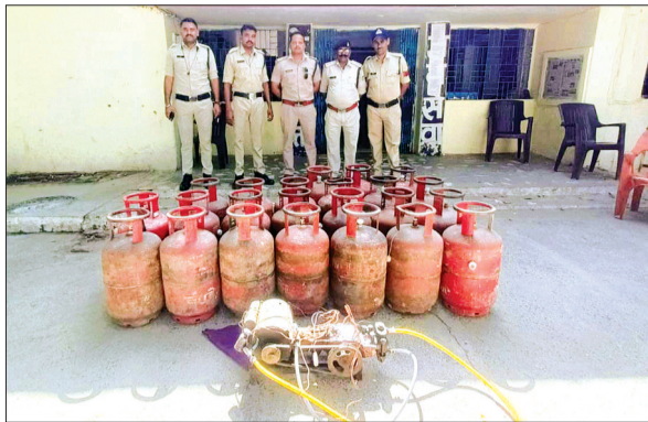
आष्टा। सीहोर रोड पर दरगाह के आगे तान मारुति सेंटर पर छापा मारा।